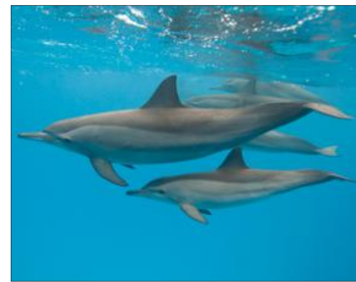
Dans les eaux claires de la mer Rouge, un jeune dauphin apprend à chasser avec sa mère.