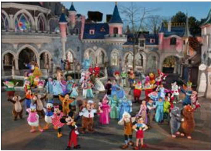
Mickey, Pinocchio, Donald, Daisy, Pluto et leurs amis vous attendent avec impatience à leur fête d'anniversaire.