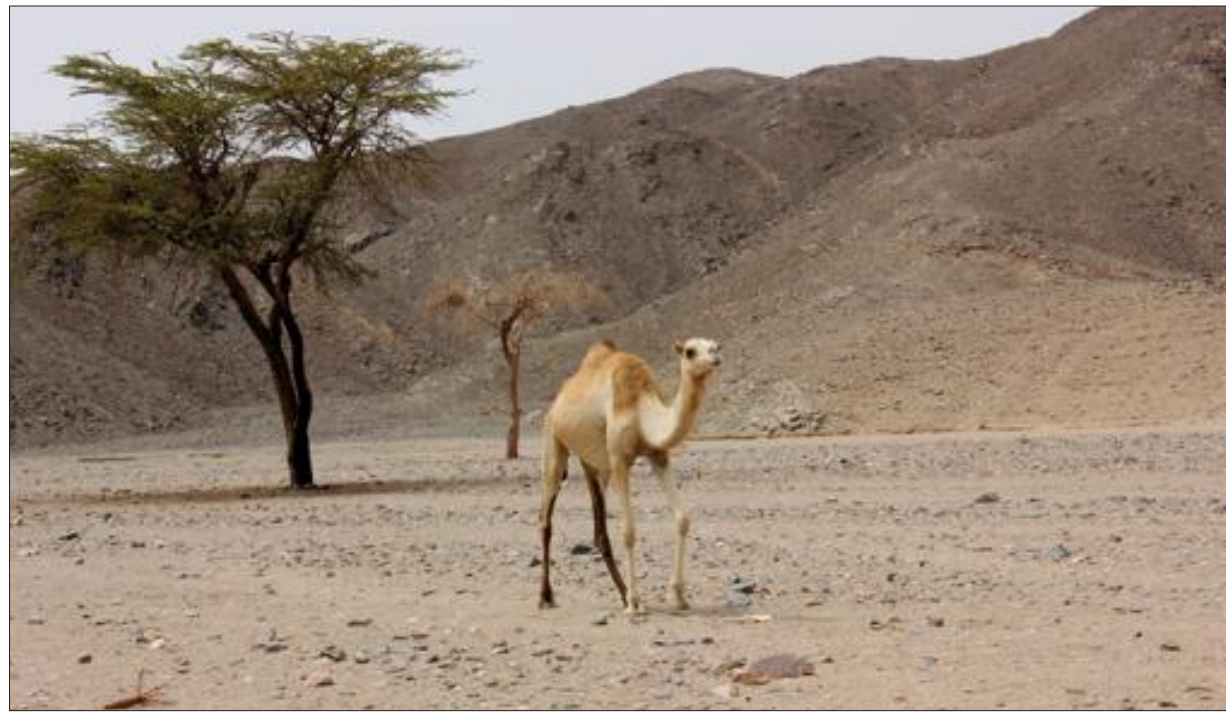
Certains animaux ont su faire de ce paysage presque lunaire leur paradis.

On retrouve également dans ce désert les vestiges de civilisations. Creusé dans la montagne, le temple d'Isis indique d'ailleurs que depuis des millénaires, l'Homme a su s'adapter à cet environnement aux conditions extrêmes.