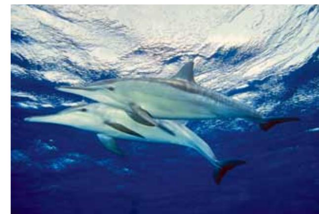
Langsnuitdolfijnen gedijen goed in nationaal park Wadi el-Gemal. Links, vanaf linksboven met de klok mee: Een Sudanese handelaar in dromedarissen in Al Shalaten; restaurant El Wadi in het Gorgonia Beach Resort serveert traditionele Egyptische desserts, zoals maamul met dadels; de schaduw van een acacia zorgt voor enige verkoeling in de Oostelijke Woestijn.

Ik voel me er, zwemmend tussen al die mariene flora en fauna, één met de natuur.