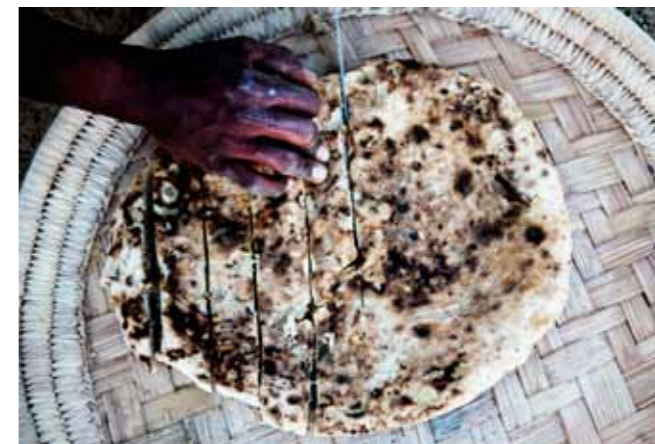
In de woestijngrond gebakken brood wordt in stukjes gesneden. Links, vanaf linksboven met de klok mee: Een Ababda-vrouw maakt traditionele sieraden voor toeristen; het smetteloze strand van Sharm El Loly Hankourab; na een rit met dromedarissen door de Oostelijke Woestijn legt een gids een vuurtje aan; op de markt in Al Shalaten zijn kruiden en specerijen als kaneel te koop.

‘Er werken door gebrek aan budget helaas te weinig parkwachters in een te groot gebied om zulke toestanden te voorkomen,’ aldus Gad. ‘Maar je moet ergens beginnen, en Gorgonia vervult daarin een voortrekkersrol.’ De zogeheten Beach Clean Up is één uiting daarvan. Water wordt hergebruikt voor het besproeien van de tuinen; dankzij een eenvoudig schakelsysteem in elke kamers gaat energie niet onnodig verloren; en de gasten ontvangen bij het inchecken een ecoboekje waarin ze worden gewezen op de ernstige gevolgen van vervuiling.